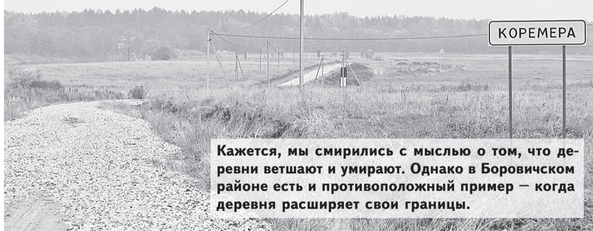
Кажется, мы смирились с мыслью о том, что деревни ветшают и умирают. Однако в Боровичском районе есть и противоположный пример — когда деревня расширяет свои границы.

К НЕБОЛЬШОЙ деревне Кореме-ра Сушанского поселения, расположенной на живописном берегу Мсты, недавно прибавилось ещё несколько соток земли. Табличка с названием населённого пункта стала примерно на километр ближе к посёлкам Первое Мая и Волгино, и теперь находится практически на границе с ними.