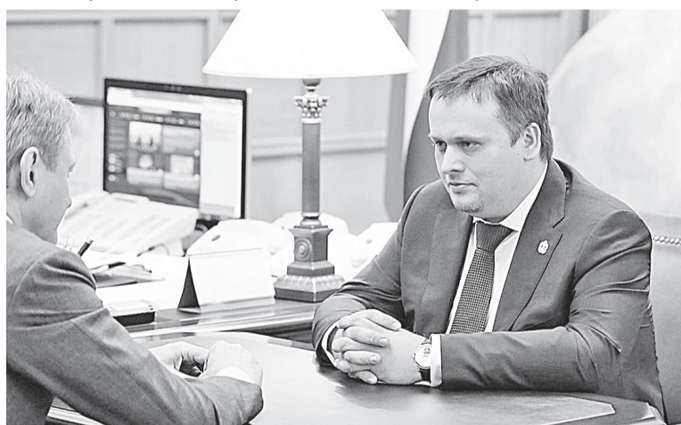
Политика губернатора Новгородской области направлена на поддержку некоммерческих организаций, малого и среднего предпринимательства

В этом году 35 организаций НКО стали победителями конкурсов грантовой поддержки областного и федерального уровней. Общий объем привлеченных средств со-